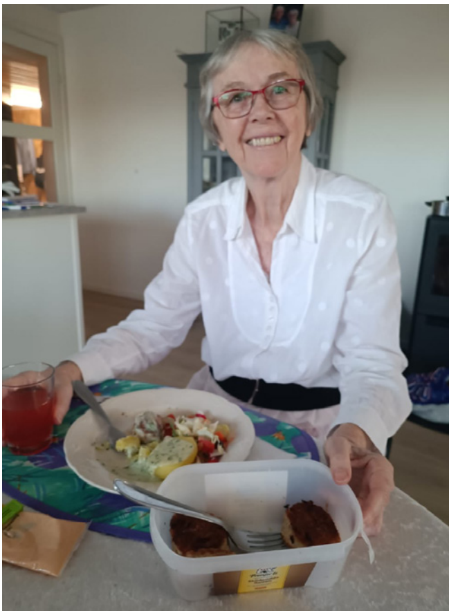
Tabitha nyder aftensmaden den 31. marts 2026

Vi havde planlagt at komme til Danmark her i april på møderejse, men måtte ændre vores planer og aflyse denne tur rundt i landet. Jeg havde gået med nogle