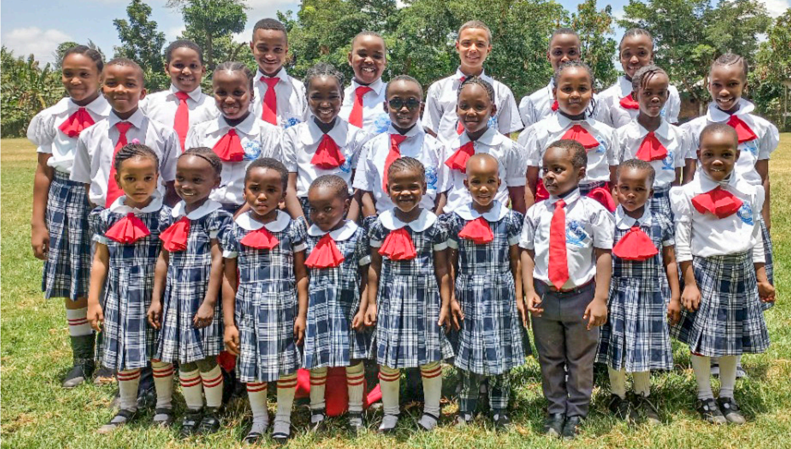
Børnene på Tumaini-skolen har fået nye skoleuniformer, som er så fine!