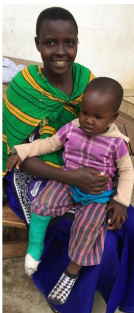
Lekaayani har været på Plaster House og er nu færdig behandlet.