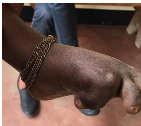
Hendes storetå er bøjet under fod og vokset fast.