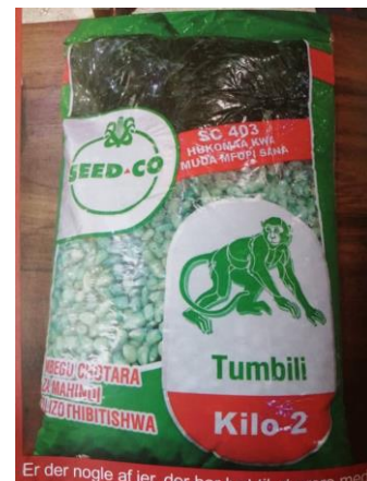
Er der nogle af jer, der har lyst til at være med?

JULEFEST MED ZEKANA GRUPPEN: Jeg sidder og evaluere årets julefest med Zekana gruppen; hvor var det en skøn fest. Det er altid så skønt at mødes med gruppen, fordi de har så meget livsglæde trods deres sygdom og prøvelser.