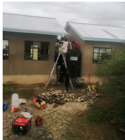
Der bliver lavet tagrender til at tilslutte de 3 x 5.000 L tanke.

Derudover har vi også været ude og tilse et projekt vi havde med at samle regnvand fra tagene på en skole i Lopolosek. Der fik de stakkels børn ingen vand at drikke hele dagen de var i skole, da der ikke var vand i miles omkreds, så det var fantastisk at kunne give dem denne gave, så de i det mindste kan få regnvand at drikke nu! Gud er bare så trofast!!