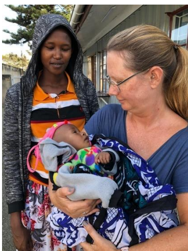
Erick da han kom til behandling i Arusha