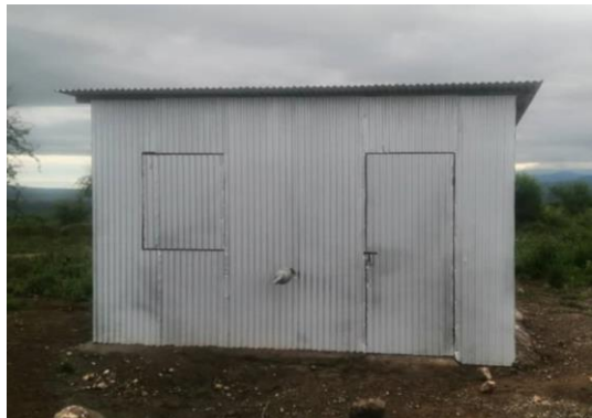
Det færdige hus til kværnen.

Vi har været i Både Lopolosek og Nadonjukin og indvie de nye majs kværne.