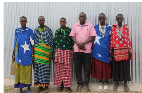
Komiteen der skal styre maskinen bestående af kvinder og landsbylederen.

I kan tro det vakte stor begejstring at få sådan en maskine og ikke skulle gå en hel dag mere for at få malet majs kerner til mel. Der blev holdt stor fest, taler og der blev givet knus, gaver og velsignelser til os. Dem vil vi gerne sende videre til jer.