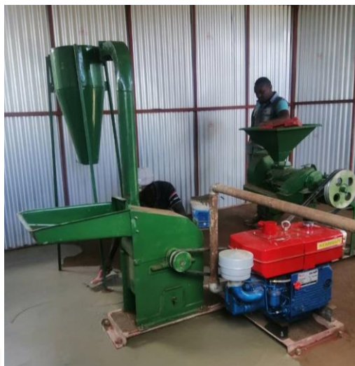
Den færdig monterede kværn. Kører på dieselmotor