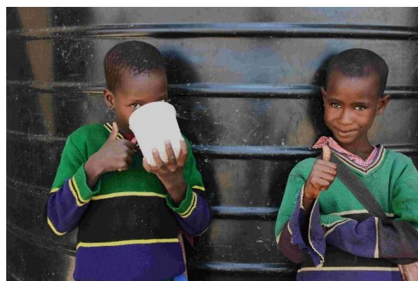
Der testes og tror billedet svarer for sig selv. Det bragte stor lykke at kunne slukke tørsten.