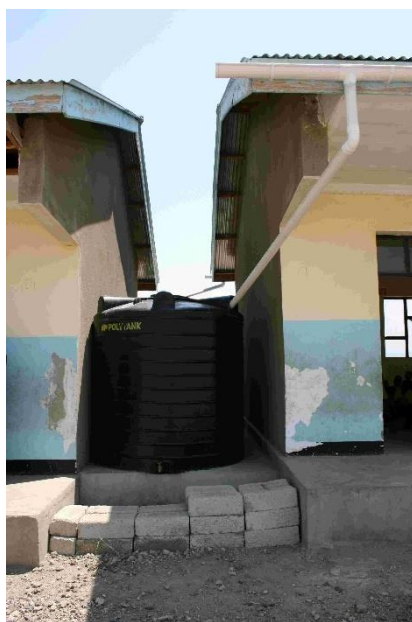
Det færdige vandopsamlings system.